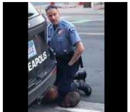
Policier appuyant son genou sur le cou de George Floyd

le tour du monde et a engendré de nombreuses manifestations contre le racisme et la brutalité policière.