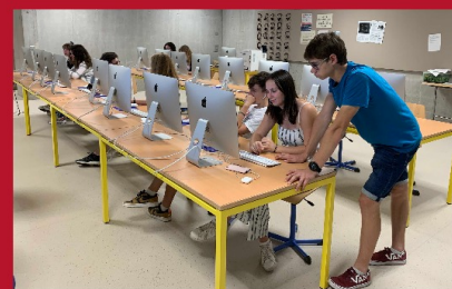
L'équipe de rédaction au taquet

Les élèves du cours FAC qui ont rédigé la Gazette des Ballons ont repris du service pour alimenter les pages de L'Impériodique Déconfiné. Finalement, ils vous présentent 16 pages d'informations variées, documentées et vérifiées. Un grand merci à eux pour leur investissement et leur créativité lors de ces dernières semaines.