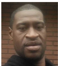
George Floyd

2005, et à 5 ans de prison pour cambriolage à main armée en 2009. Après être sorti de prison, il déménage à Minneapolis dans le Minnesota, ville où il va être asphyxié par trois policiers. La vidéo de ce meurtre a fait