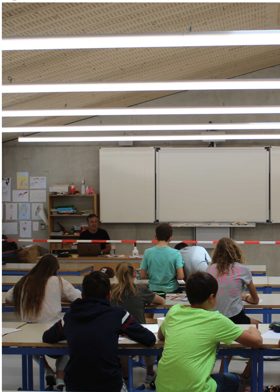
Restrictions scolaires, photo: Maxime

Nous espérons de tout cœur que cette situation ne se répétera pas de si tôt. De notre côté, nous pourrions dire à nos enfants que nous avons vécu un événement historique !