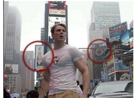
Captain America : First Avenger

Beaucoup de gens croient que le film Captain America : First Avenger sorti en 2011 aurait prédit le coronavirus ! Sur cette image, nous remarquons une bière Corona et un virus identique au Covid-19 !