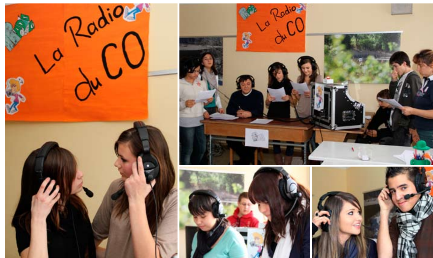
Sion «La Radio du CO» est un projet mené au Cycle d'orientation de Saint-Guérin ( http://laradioduco.wordpress.com/ ). Un outil très motivant pour les élèves.

RadioBus. Si une telle démonstration peut être présentée à Palexpo, c'est grâce à un travail de longue haleine. Tout d'abord avec le RadioBus, un véhicule équipé par la Radio suisse romande en 1986, et destiné à la casse. Celui-ci, un véritable